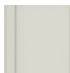
7535 Světle šedá krycí RAL 7035